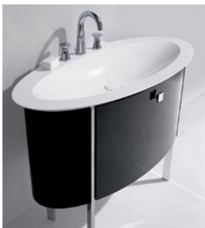
Burgbad kolekcija Diva

Vadošo ražotāju (Villeroy&Boch, Ideal Standard, Duravit u.c.) piedāvājumā arī oriģināli izlietņu komplekti un dubultizlietnes, kas paredzētas iespējai baudīt higiēnas rituālus divatā vai vienkārši laika ekonomijai. Piemēram, no rīta, kad visai ģimenei vienlaicīgi aktuāla rīta higiēna. Izvēloties jebkuru no izlietņu veidiem, noteikti jāpievērš uzmanība produkta komunikāciju uzbūvei. Ja konsolēm un mēbelēs iebūvētajām izlietnēm ūdens un kanalizācijas izvade iespējama tikai no sienas, tad izlietnēm ar kāju – arī no grīdas. Katrai konkrētai situācijai un telpai piemērotāko variantu ieteiks profesionāls salona speciālists vai interjera dizainers.