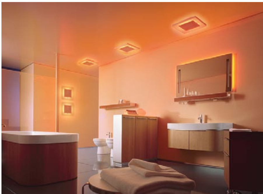
Duravit kolekcija E-mood

Īpaša uzmanība šodien tiek veltīta vannas istabas apgaismojumam – kā dizaina elements tas kļuvis par neatņemamu interjera sastāvdaļu un nereti pilda krāsu terapijas funkcijas. Piemēram, Duravit (Vācija)