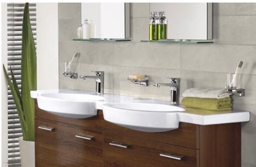
Villeroy&Boch kolekcija Variable

Vadošo ražotāju (Villeroy&Boch, Ideal Standard, Duravit u.c.) piedāvājumā arī oriģināli izlietņu komplekti un dubultizlietnes, kas paredzētas iespējai baudīt higiēnas rituālus divatā vai vienkārši laika ekonomijai. Piemēram, no rīta, kad visai ģimenei vienlaicīgi aktuāla rīta higiēna. Izvēloties jebkuru no izlietņu veidiem, noteikti jāpievērš uzmanība produkta komunikāciju uzbūvei. Ja konsolēm un mēbelēs iebūvētajām izlietnēm ūdens un kanalizācijas izvade iespējama tikai no sienas, tad izlietnēm ar kāju – arī no grīdas. Katrai konkrētai situācijai un telpai piemērotāko variantu ieteiks profesionāls salona speciālists vai interjera dizainers.