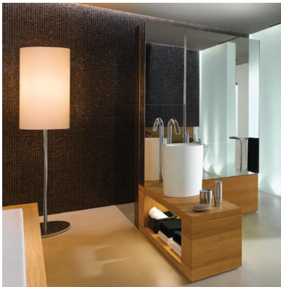
Keuco kolekcija Atelier

No dažādiem materiāliem izgatavotais santehnikas, vannas istabas mēbeļu un aksesuāru sortiments ietver vairākus produktu veidus ar atšķirīgām pielietojuma iespējām.