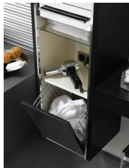
Keuco kolekcija Plan b free

Mūsdienīgs un aktuāls vannas istabas mēbeļu papildinājums ir stikla sienas un durvis. No stikla izgatavo arī dažādus plauktus, virsmas un, protams, spoguļus. Atšķirībā no masveida produkcijas, komforta un luksusa stikla izstrādājumiem un spoguļiem ir apsildes sistēmas un speciāla aizsargkārtas. Tas nodrošina vieglu kopšanu un