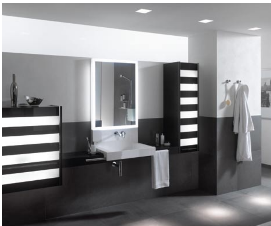
Keuco kolekcija Plan b free

Lai lietderīgi izmantotu finansiālos un laika resursus, kā arī neradītu sev nepatīkamus pārsteigumus, vannas istabas komplektāciju vēlamams veikt noteiktā secībā. Pretējā gadījumā rezultāts praktiski nav prognozējams.