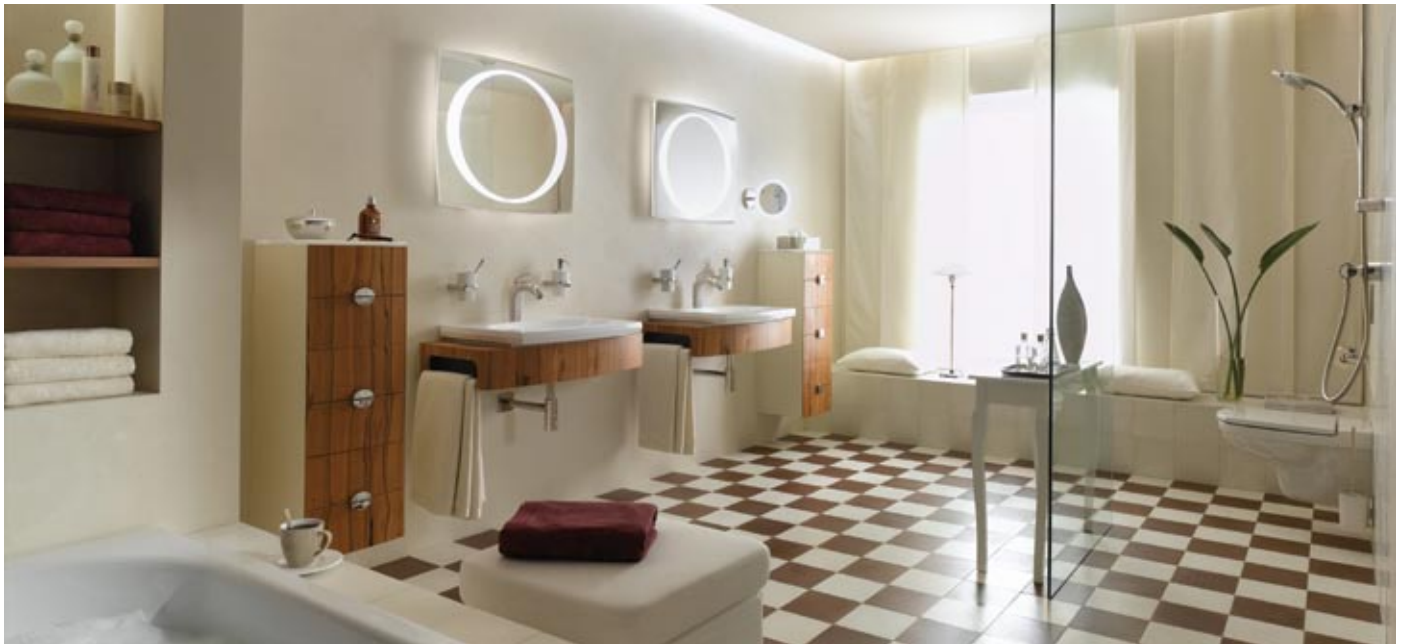
Keuco kolekcija Palais

Vannas istabas mēbeles un aksesuārus iedala uz grīdas novietojamos, pie sienas stiprināmos vai mobilos (pārvietojamos). Izvēles pamatā ir telpas ergonomika un stils, bet rezultāts parasti ir kompromiss starp Jūsu vēlmēm, vajadzībām un iespējām. Galvenais izvēles priekšnoteikums ir – minimāls priekšmetu skaits ar maksimālām komforta iespējām. To šodien nodrošina Eiropas vadošie ražotāji, kas uz dažādu socioloģisko pētījumu bāzes izstrādā ergonomiskus un estētiskus produktus.