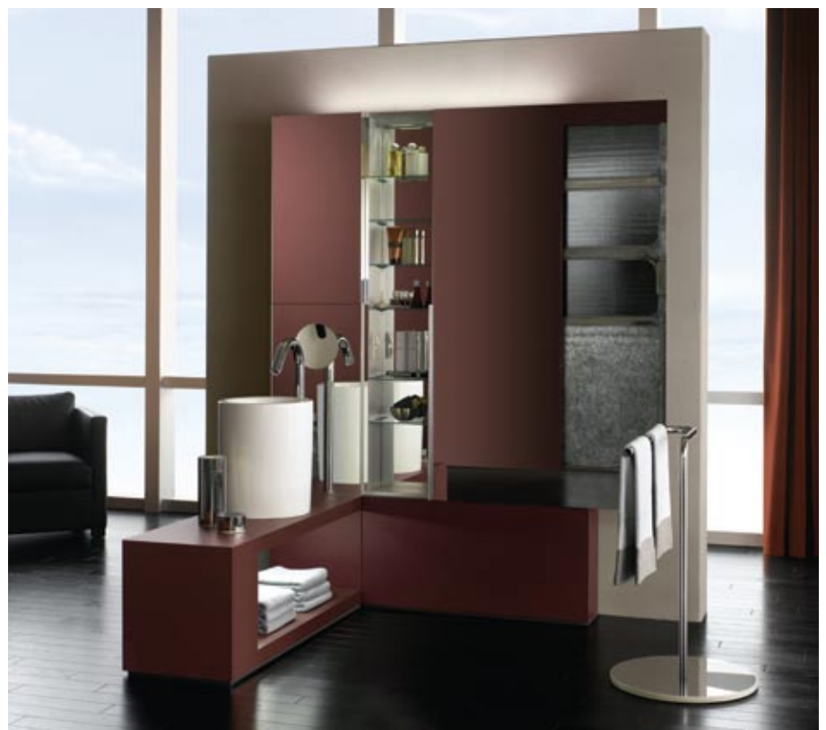
Keuco kolekcija Atelier

Kompetenta izvēle nodrošinās Jums pozitīvas emocijas ikdienā un komfortu ilgtermiņā, jo vannas istabas komplektācija ir investīcijas Jūsu veselībai un labsajūtai!