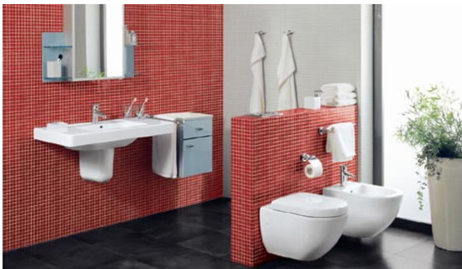
Villeroy&Boch kolekcija Subway

Komforta klases kategorijā šodien ir plaša un daudzveidīga vannas istabas kolekciju izvēle. Vienas no pieprasītākajām Latvijā ir Vācijas ražotāja Villeroy&Boch kolekcijas Subway , Omnia Architectura , Sunberry , Duravit dizaineru radītās Starck3 , Happy D un vairāku citu vadošo ražotāju piedāvājumi. Tā ir viena no drošākajām iespējām nekļūdiģi realizēt vizuāli un ergonomiski saskaņotu vannas istabas komplektāciju augstvērtīgā kvalitātē.