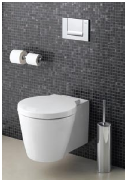
Keuco kolekcija Atelier