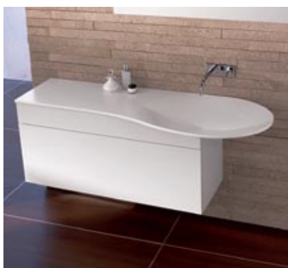
Burgbad kolekcija Pli

Vairākiem stiliem ir arī dažādi apakšnovirzieni. Piemēram, šodien populārā neoklasika ir stilistiski vieglāks klasikas variants, Hi-tech ir minimālisma variācija u.c. Kā atsevišķu kategoriju var pieminēt angļu stilu , kurā joprojām aktuālas konservatīvas vēsturiskas vērtības. Piemēram, ķēdīte vai aukliņa ūdens noskalošanai, atsevišķi aukstā un siltā ūdens krāni u.c.