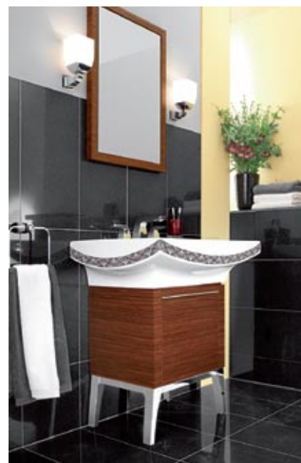
Villeroy&Boch kolekcija Bellevue

ražo augstvērtīgas iebūvējamās sistēmas santehnikai, Zierath (Vācija) ražo un pieņem individuālus pasūtījumus visdažādāko veidu ekskluzīvu spoguļu izgatavošanā, bet Sprinz (Vācija) piedāvā unikālu daudzveidību stikla izstrādājumu jomā – pēc individuāla pasūtījuma tiek ražotas dažādas formas un izmēru stikla sienas un dekoratīvi stikla aizsegi radiatoriem, stikla duškabīnes, kāpnes un aksesuāri.