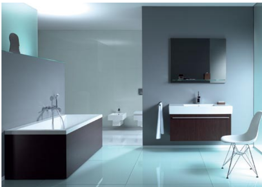
Duravit kolekcija Vero

Lai apmierinātu 21.gadsimta patērētāju augošās prasības pēc