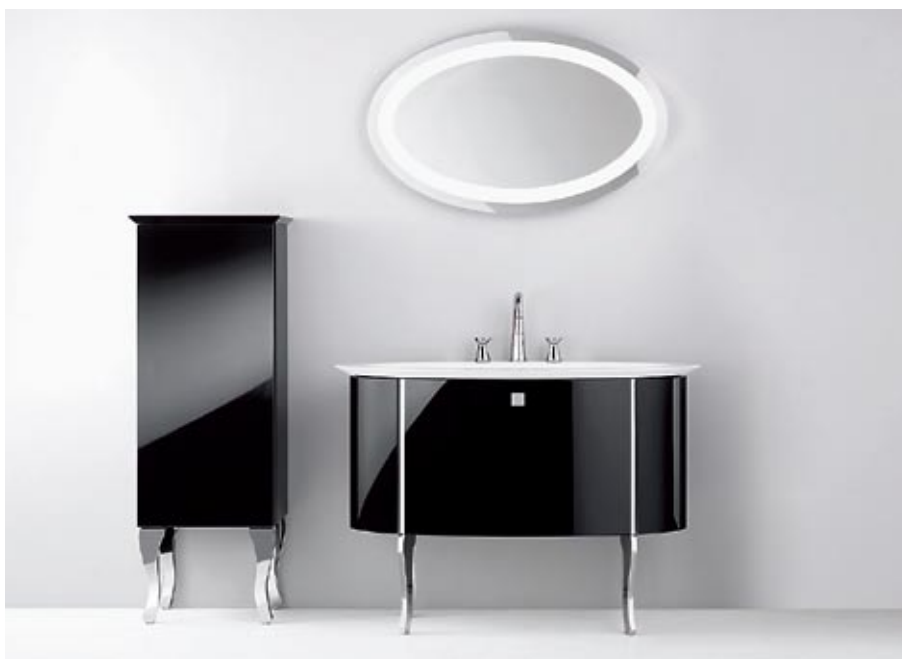
Burgbad kolekcija Diva

5. Eklektika jeb dažādu stilu apvienojums vienā telpā ir mūsdienas aktualitāte, kas dod iespēju izveidot unikālu un neatkārtojamu vannas istabu. Tas ir vispersoniskākais no visiem stiliem, bet tā realizācijai noteikti nepieciešams profesionālis, kas prot savienot it kā nesavienojamo un izcelt Jūsu personību ar dažādu stilu palīdzību.