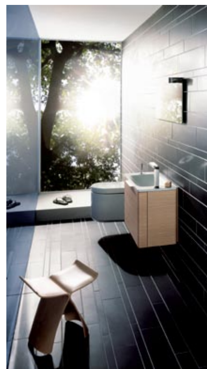
Jado kolekcija Glance Welcome