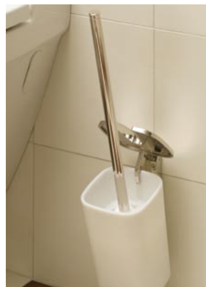
Keuco kolekcija Palais

Katra ražotāja produkcijai, kolekcijai un produktu sērijai ir sava specifika un atšķirīgi parametri, tāpēc katram mehānismam piemērojami tikai tam paredzētie vizuālie elementi.