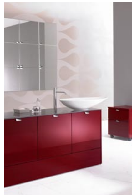
Burgbad kolekcija RC-40

5) produkta zīmols – ražotāja kvalitātes garantija.