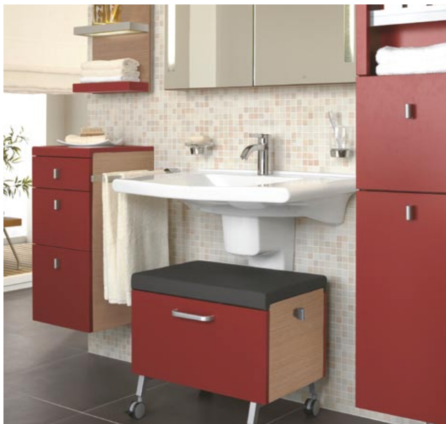
Villeroy&Boch kolekcija Lifetime

Dabīgie materiāli (finieris un masīvkoks), protams, ir dārgāki, bet nevar teikt, ka kāds no minētajiem materiāliem būtu labāks vai sliktāks. Izvēle, galvenokārt, atkarīga no tā, vai dabīgs materiāls ir Jūsu prioritāte. Tikai nav jāsatraucas, ja ekskluzīva masīvkoka skapim durvis saules ietekmē ar laiku paliks gaišākas – tā ir dabīga materiāla īpašība un unikāla vērtība!