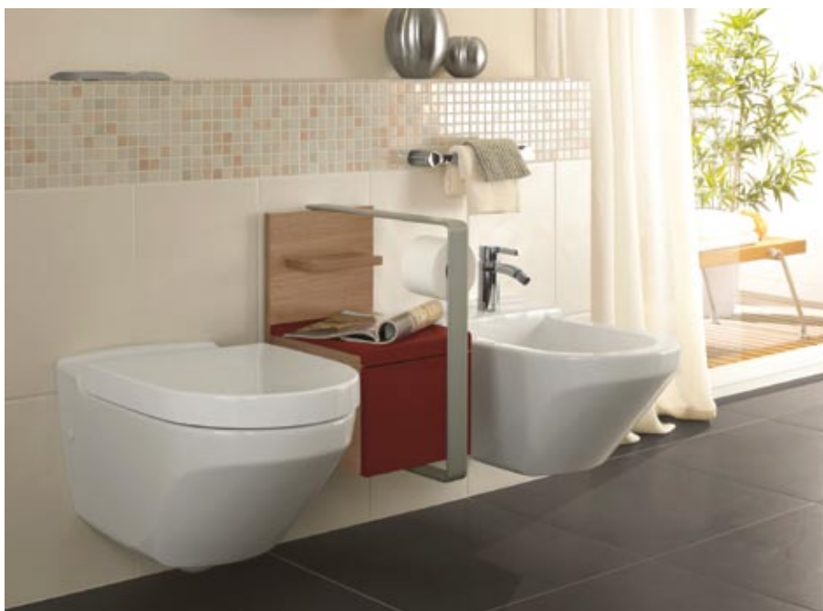
Villeroy&Boch kolekcija Lifetime

gala produkts, zem augsta spiediena izpresē dažādas formas un dizaina santehnikas izstrādājumus. Tad tos vairākas stundas žāvē, pārklāj ar 0,7-0,8mm biezu, stiklam līdzīgu glazūru (baltā vai kādā citā krāsā) un apdedzina 1250–1400°C temperatūrā. Pēc apdedzināšanas produkta virsma iegūst gludu un spīdīgu glazūras pārklājumu, kas nodrošina tam nepieciešamo higiēnas līmeni.