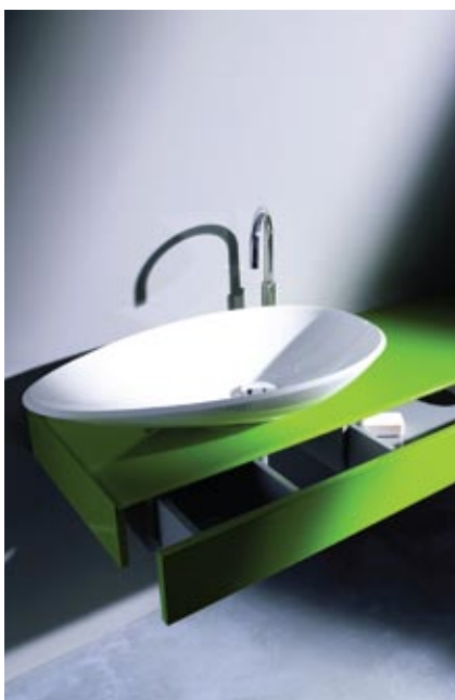
Burgbad kolekcija RC-40

Viens no drošākajiem izvēles variantiem ir Eiropas vadošo ražotāju vannas istabu kolekcijas, kurās profesionāli izstrādāts viss telpas aprīkojums, kas ietver ergonomiski un stilistiski saskaņotu sanitāriku, mēbeles un aksesuārus.