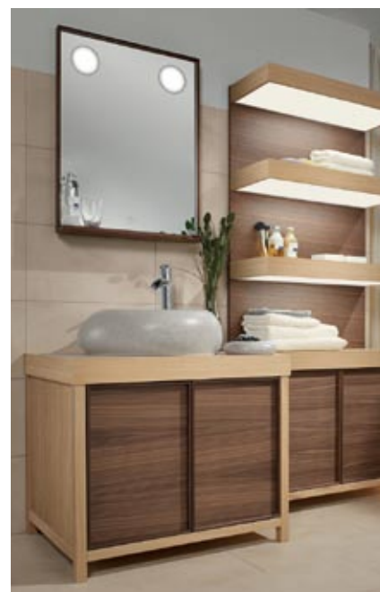
Villeroy&Boch kolekcija Pure Stone