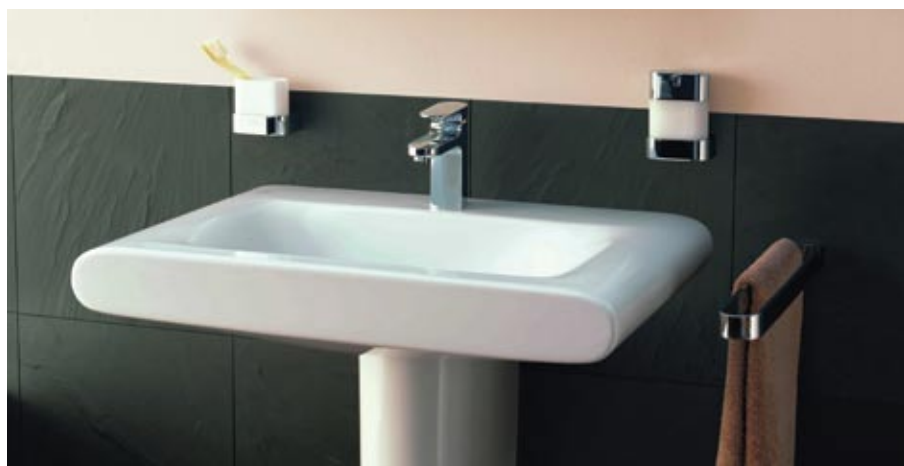
Ideal Standard kolekcija Moments