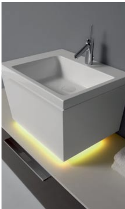
Burgbad kolekcija Culta

Tie ir tikai daži piemēri no plašā un daudzveidīgā piedāvājuma, kas šodien pārstāvēts arī Latvijas tirgū. Detalizētu informāciju un profesionālu atbalstu izvēles jomā jautāriet vadošo santehnikas salonu speciālistiem. Ja priekšroku dosiet būvmateriālu lielveikalu sortimentam, tad gan varēsiet pajauties tikai uz savām zināšanām, jo šīs tirdzniecības vietas, kas darbojas pēc principa „dari pats” vai „veikals-noliktava”, neparedz profesionālu konsultāciju sniegšanu.