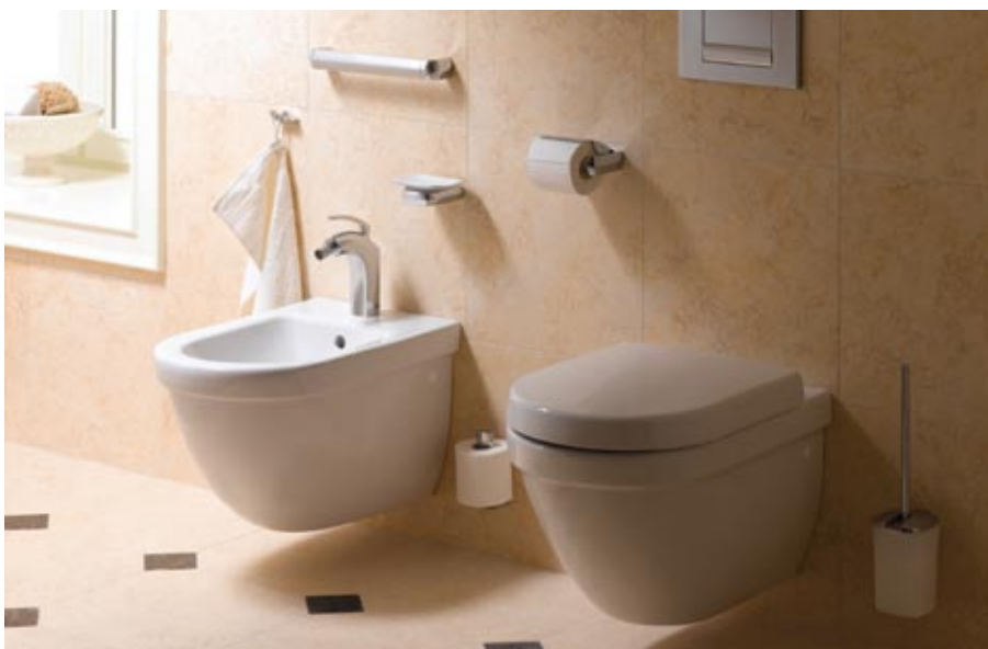
Keuco kolekcija Palais

rinājumus klozetpoda instalācijai. Vienīgā vizuālā sastāvdaļa ir sienā redzamais elements jeb „nospiežamā poga” ūdens skalošanai, kas jāiegādājas atsevišķi. Ieteicams sākt tieši ar vizuālā elementa izvēli , jo lielākajai daļai iebūvējamo mehānismu piedāvājumā dažādu krāsu, formu un materiālu „pogas” – izvēle atkarīga no Jūsu gaumes, telpas dizaina un sienu apdares materiāla. Ja sāksiet ar mehānisma iegādi, tad ievērojami ierobežosiet savas izvēles iespējas – praktiski neiespējami viena ražotāja mehānismam pievienot cita ražotāja mehānisma „pogu”.