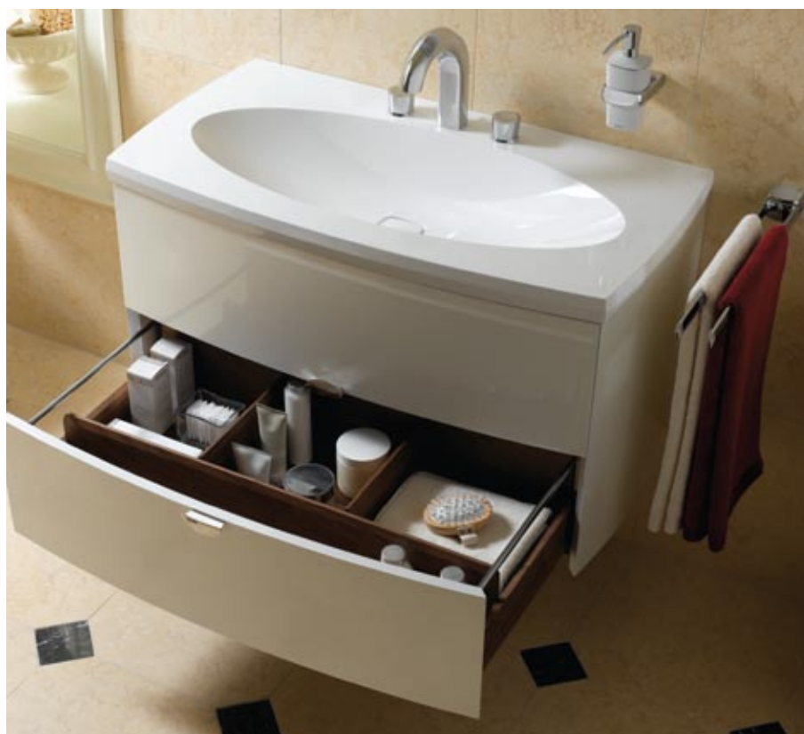
Keuco kolekcija Palais

Ja Jūs saista nestandarta risinājums un vēlaties vienā telpā izvietot dažādu materiālu un cenu kategorijas santehniku, tas, protams, ir izdarāms. Tikai veiksmīgam rezultātam noteikti nepieciešama profesionāla interjera dizainera palīdzība!