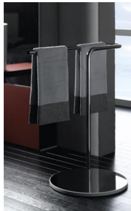
Keuco kolekcija Atelier