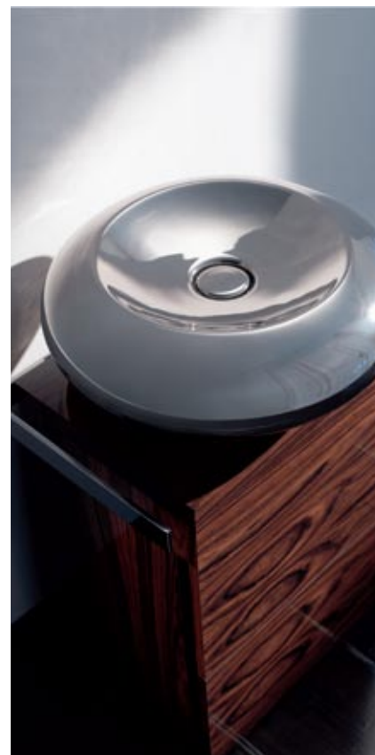
Duravit kolekcija Ciottolo

Ja liela izmēra vannas istabā var izvietot arī vairākas izlietnes, kas vizuāli un funkcionāli papildina viena otru, tad nelielām telpām piemērotāks parasti ir kāds no pirmajiem diviem izlietņu veidiem. Nav izslēgts arī trešais variants – viss atkarīgs no telpas ergonomiskā plāna, produkta izmēra un dizainera profesionalitātes!