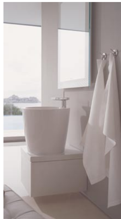
Duravit kolekcija Starck X