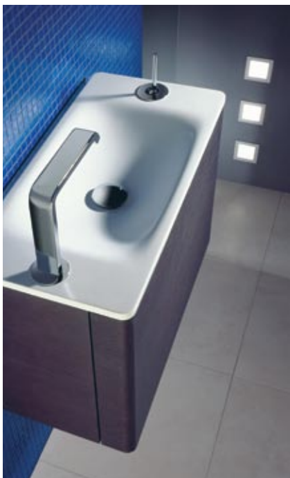
Jado kolekcija Glance Welcome

Piemēram, Burgbad (Vācija) vannas istabas mēbeļu kolekcija Diva ir izsmalcināta glamour variācija, kolekcijas Gloria baltās masīvkoka mēbeles ar apzeltījumu pārstāv elegantu klasiku, bet kolekcija Sound pārsteidz ar tehnoloģisku novitāti – spoguļskapīšos ievietotie MP3 vai Ipod (pēc izvēles) ļauj baudīt relaksāciju savas iemīļotās mūzikas pavadījumā. Kolekcijas Culta izgaismotās mēbeles pārlicinoši pretendē uz kulta objekta statusu, bet Pli kolekcijas dizainā dominē unikāla apļa un kvadrāta sintēze.