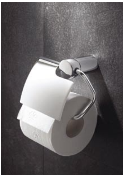
Villeroy&Boch kolekcija Soul

Visās ūdens skalošanas kastēs jau ir iestrādāti produkta uzbūvei un dizainam atbilstoši skalošanas mehānismi un vizuālie elementi. Izvēloties kādu no šiem produktu variantiem, jāpievērš uzmanība izvadu uzbūvei. Pie sienas piekaramiem podiem kanalizācijas izvade paredzēta tikai no sienas, bet uz grīdas instalējamiem – arī no grīdas. Savukārt, ūdens padeve abiem modeļiem iespējama gan no kastes apakšas, gan no aizmugures un sāniem. Atbilstoši vēlmēm un iespējām, izvēlētajam klozetpoda veidam var pieskaņot funkcionāli un vizuāli atbilstošu bidē un/vai pisuāru. Augstu komforta līmeni šodien nodrošina izstrādājumi ar Soft Closing sistēmu – poda vāks aizveras pats, pie tam – ļoti klusi, lēni un mierīgi. Tādus modeļus piedāvā, piemēram, Vācijas ražotāji Duravit, Ideal Standard un Villeroy&Boch.