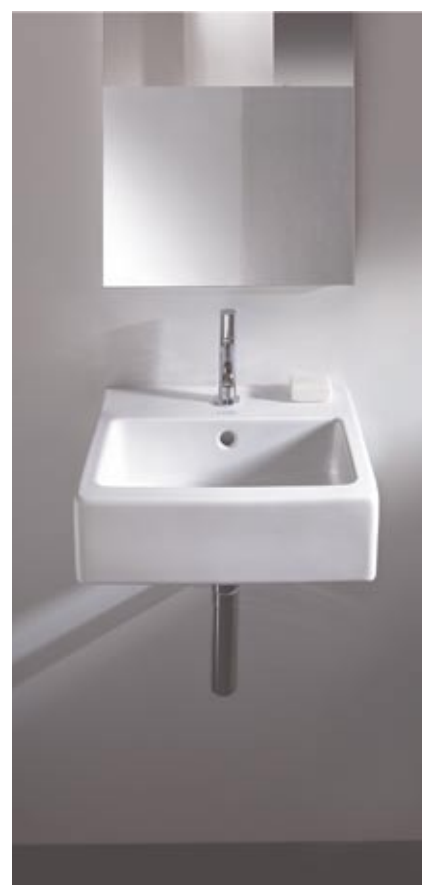
Duravit kolekcija Verò