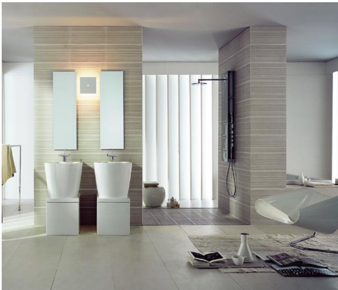
Duravit kolekcija Starck X