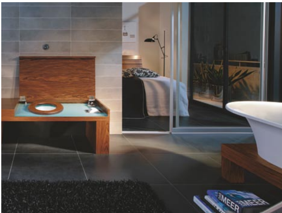
Villeroy&Boch kolekcija City Life