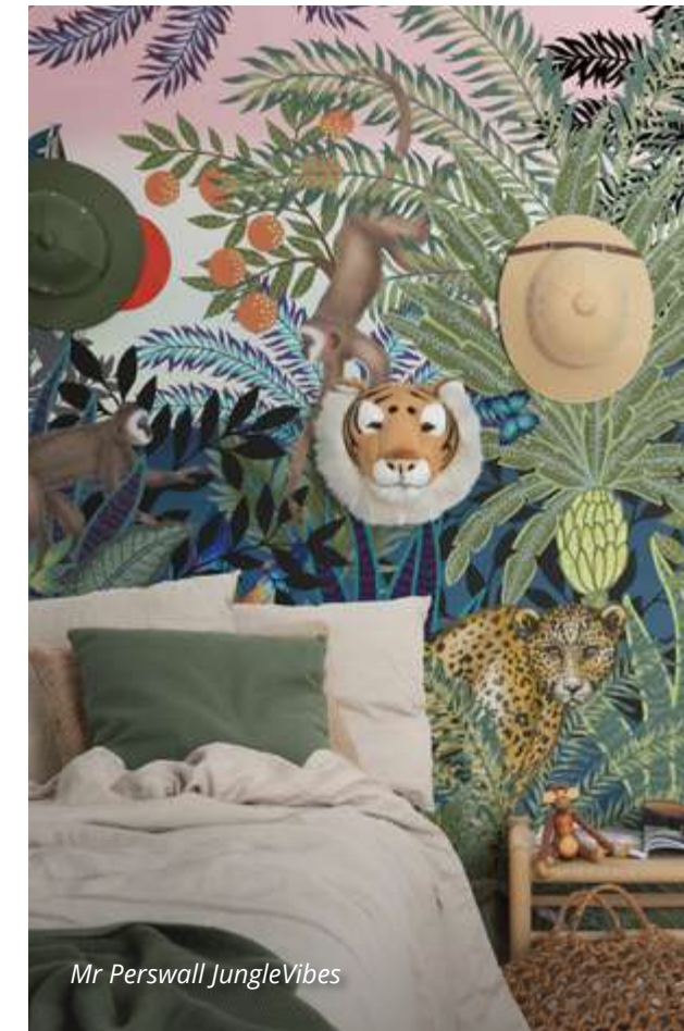
Mr Perswall JungleVibes

Orientēties plašajā tapešu piedāvājumā un izvēlēties sev piemērotāko nav vienkārši, bet kļūdities – pavisam viegli. Nav ieteicams iegādāties tapetes mirkļa iespaidā un „uz labu laimi”, jo veikalā iepaticies paraugs var izrādīties funkcionāli nepiemērots un vizuāli neatbilstošs sienas segums iecerētajam interjeram.