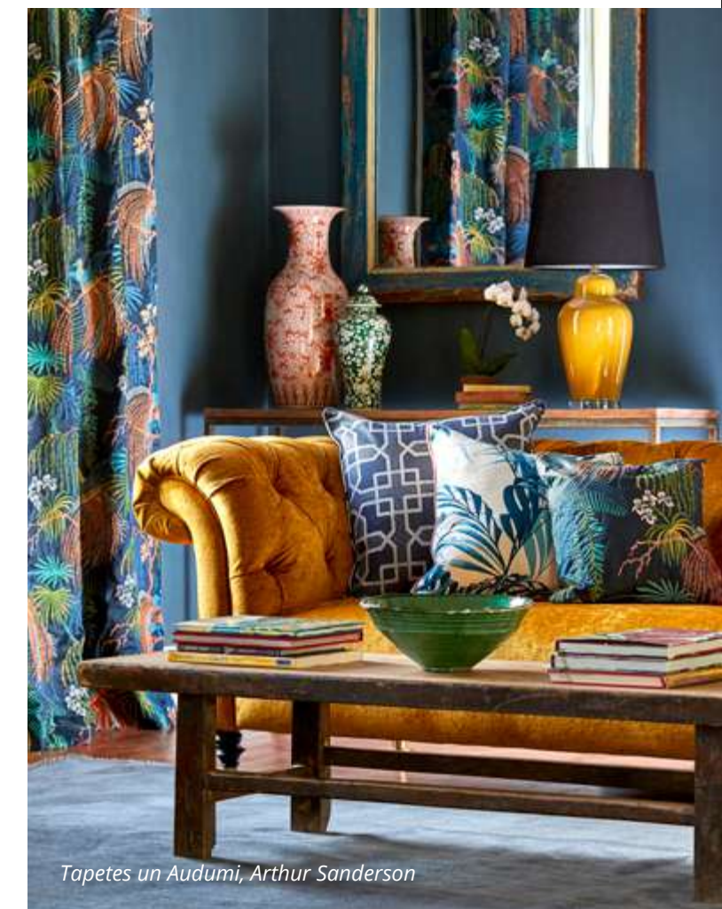
Tapetes un Audumi, Arthur Sanderson

pieejamos un atjaunojamus resursus. Funkcionalitāte tiek uzskatīta par prioritāti, kas liek koncentrēties uz tehniskajiem tekstilizstādējumiem un uz izpildījumu balstītu dizainu. Rezultātā tapešu un audumu nokrāsu intensitāte variē ar tekstūru, gludi audumi, sportiski krāsu toņi, asfalta pelēkais, vienveidīgi zils, dzeltens.