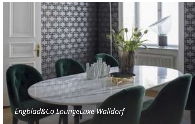
Engblad&Co LoungeLuxe Walldorf