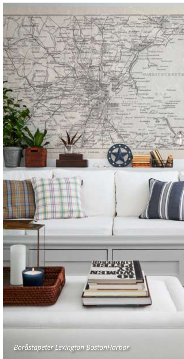
Borāstapeter Lexington BostonHarbor