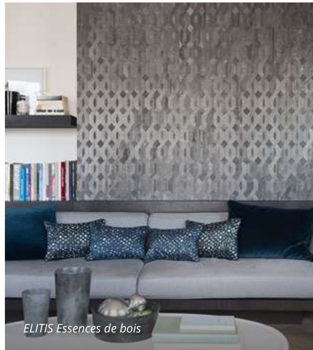
ELITIS Essences de bois

Tapešu pamatsastāvā ir dažādi dabīgie materiāli, zīds, viskoze, spalvas, džuta, bambuss, kokšķiedras finierējums, perlamutra, koks, gliemežvāki, palmu un cita veida pārklājums. Palielinoties interesei pēc ekoloģiskiem, dabiskiem materiāliem interjerā, pēdējos gados mājokļu sienas tiek noklātas ar materiāliem, kuru dizainu elementus atspoguļojas daba (koki, zaļumi, ziedi un citi).