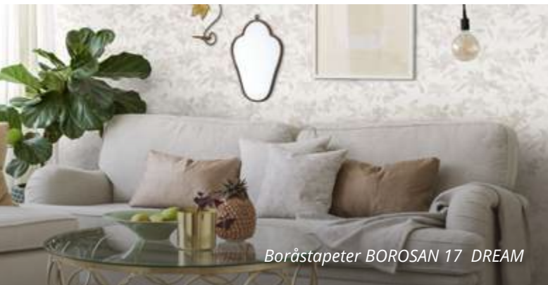
Borāstapeter BOROSAN 17 DREAM