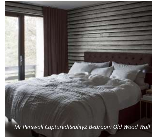
Mr Perswall CapturedReality2 Bedroom Old Wood Wall

Pirms tapešu iegādes rūpīgi jāpārdomā, kāda izmēra un kādas funkcijas telpai materiāls paredzēts, kāds tur būs apgaismojums un cik bieži tajā iespīdēs saule, kādā stilā iecerēts interjera dizains un vis- beidzot kādas sajūtas un emocijas vēlaties baudīt šajā telpā!